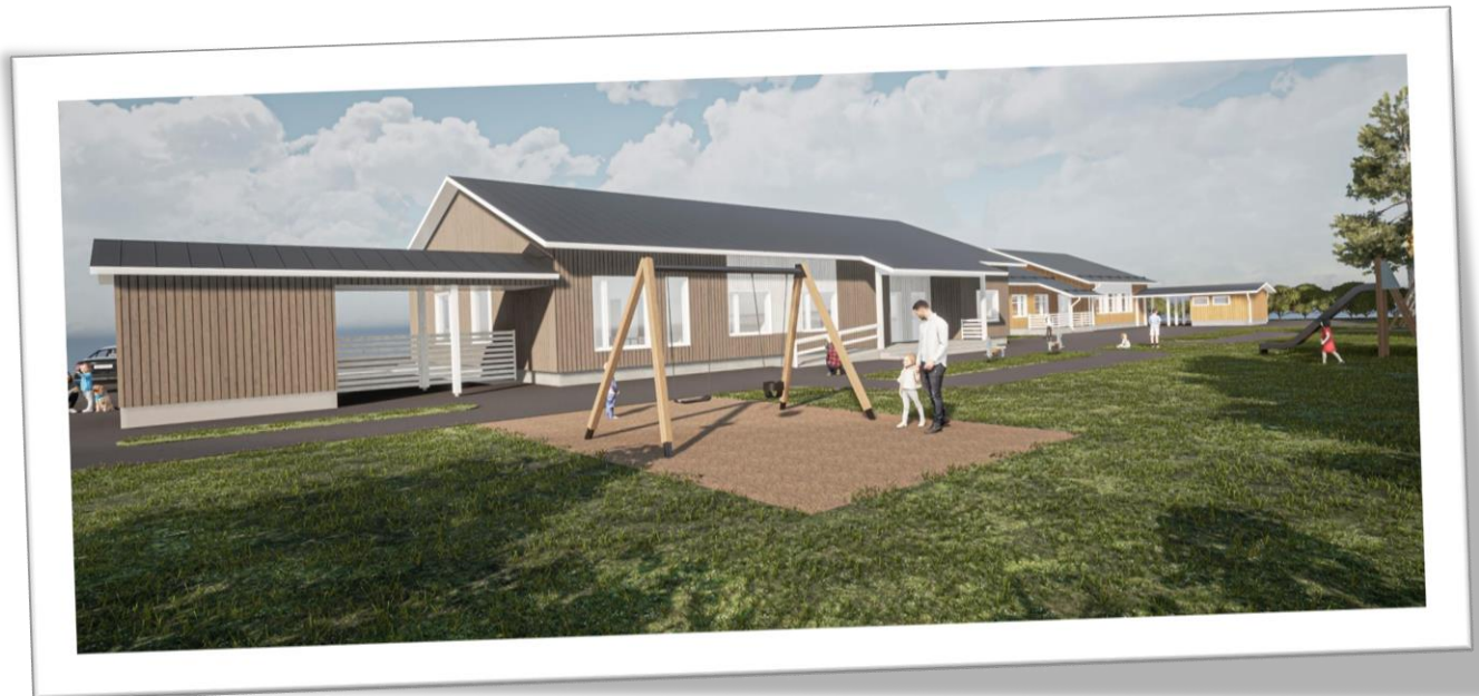
Keltasirkun päiväkodin laajennusosa