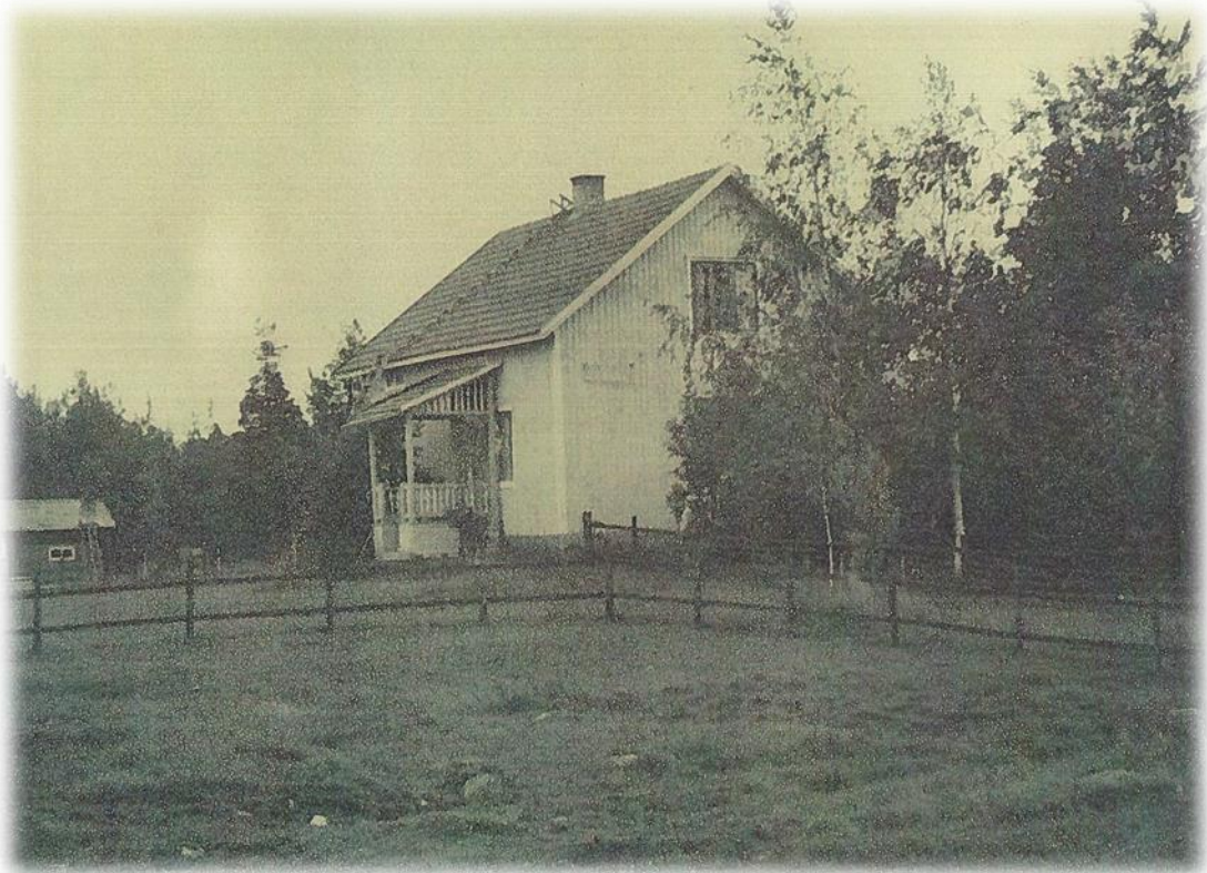
Hannulan talo ja pihapiiri vuoden 1960 tienoilla